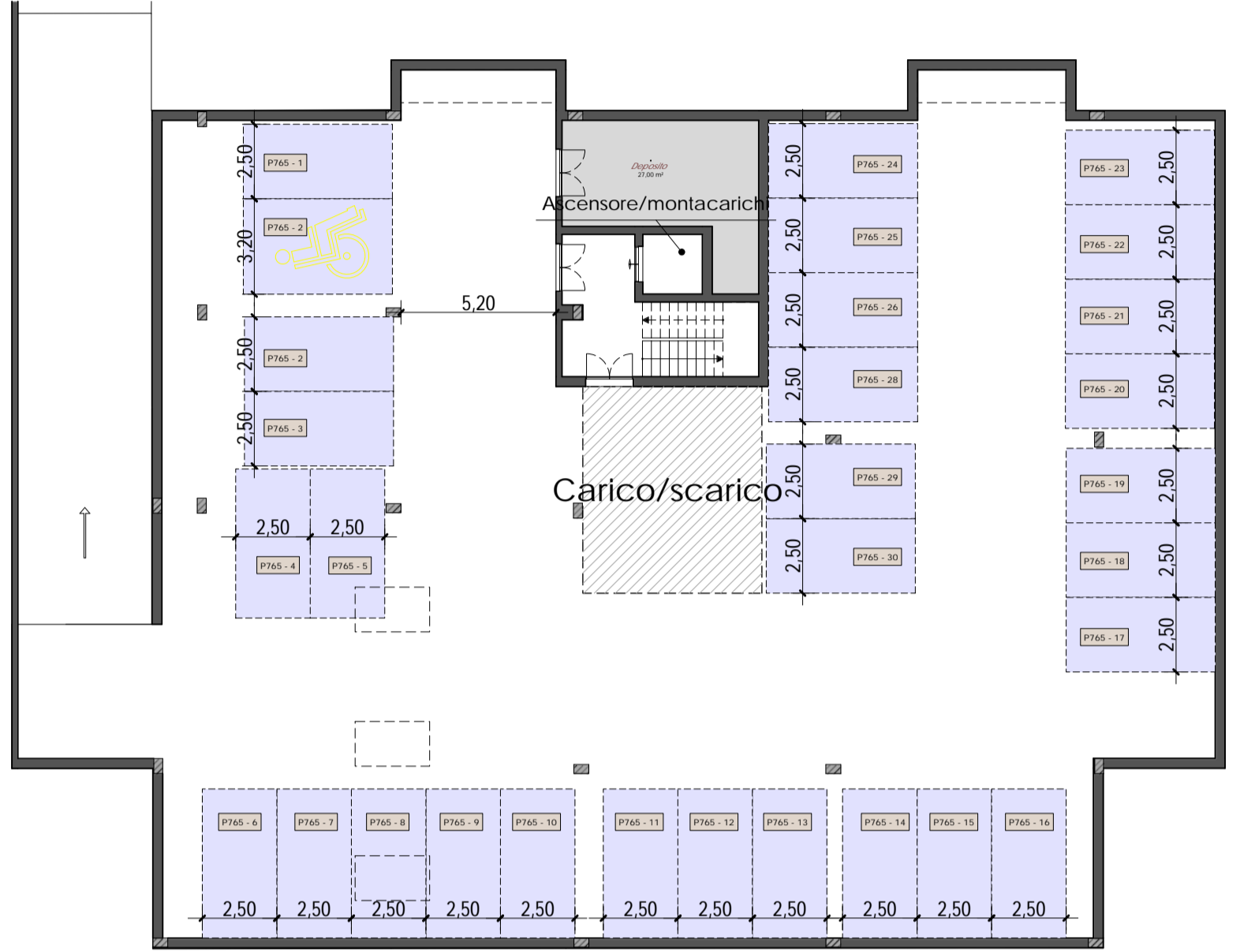
INTERRATO - COMMERCIALE Scala 1:200